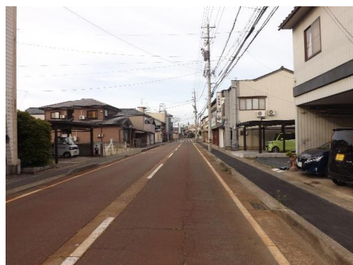
前面道路 写真奥が市役所